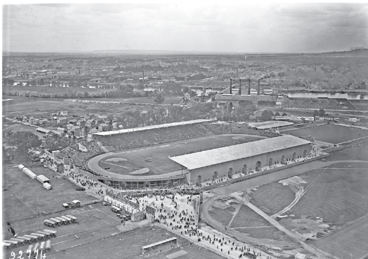
Site des Jeux olympiques 1924 et 2024: Stade olympique Yves-du-Manoir, Colombes.